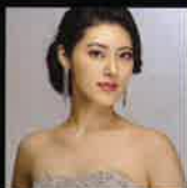
堤 貴恵 (メゾソプラノ)