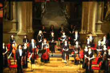
ロイヤルチェンバーオーケストラ