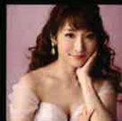
辰巳 真理恵 (ソプラノ)